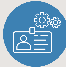
Wirtschaft und Beschäftigung