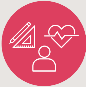
Bildung, Soziales und Gesundheit