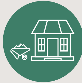
Bauen und Wohnen