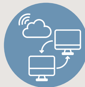
Verwaltungsmodernisierung und Digitalisierung