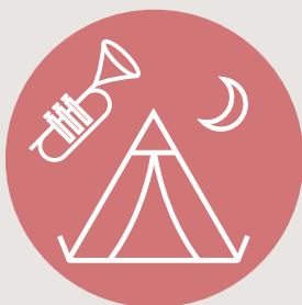
Tourismus, Kultur und Freizeit