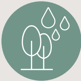
Umwelt und Landwirtschaft