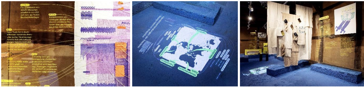
Abb. 18–20 Ausschnitt des Zeitstrahls, Kartenprojektion und Fühlstation in der Ausstellung VERFLOCHTEN. Wendländisches Leinen und Kolonialismus

Die Ausstellungstexte stehen über QR-Codes auch in Englisch und Einfacher Sprache zur Verfügung. Zudem liegt in der Ausstellung ein Glossar aus, das komplexe Begriffe aus den Ausstellungstexten erläutert.