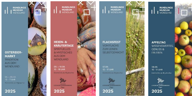
Abb. 2–6 Veranstaltungsflyer aus dem Jahr 2025, Vom Oster Eiermarkt bis zum Apfeltag