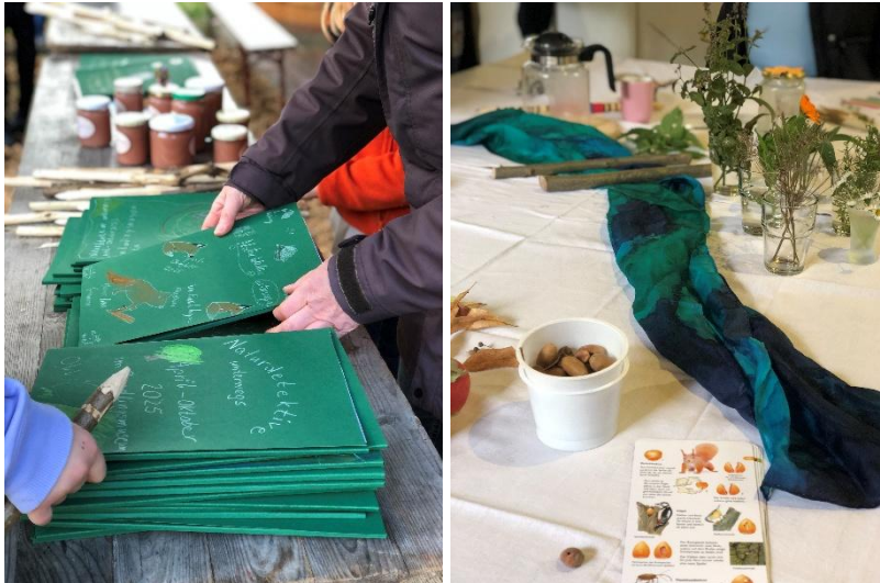
Abb. 21 u. 22 „Naturdetektive unterwegs – Umweltbildungsprojekt im Rundlingsmuseum Wendland“ mit der Grundschule Lüchow, 2025.