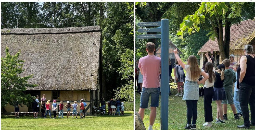
Abb. 23 u. 24 Abschlussveranstaltung der neuen Junior Guides der KGS Clenze. Führung der Grundschulklasse der Grundschule Lüchow.