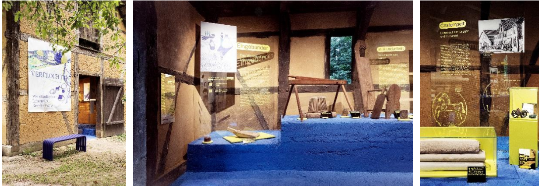
Abb. 15–17 Ausstellungseinblicke in VERFLOCHTEN. Wendländisches Leinen und Kolonialismus, Fotografien: Marie-Theres Böhmker

Von den vier Dauerausstellungen (Rundlingsausstellung, Trachtenausstellung, Flachs und Leinen sowie Parum-Schultze-Chronik) und historisch eingerichteten Gebäuden (Heimathaus, Stellmacherei, Schmiede), wurde 2025 die Ausstellung zu Flachs und Leinen neu konzipiert und im August eröffnet. Zusätzlich wurde eine Sonderausstellung gezeigt.