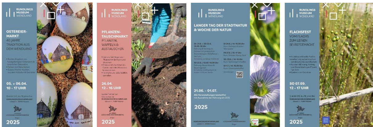
Abb. 7–10 Auswahl Veranstaltungsplakate aus dem Jahr 2025, Vom Oster Eiermarkt bis zum Apfeltag

Seit Saisonstart 2025 können im Museumsshop eigens entwickelte und gebrandete Produkte des Museums erworben werden. Dazu zählen eine hochwertige Schürze mit Siebdruck in Schwarz und dem Korallton, ein Geschirrtuch aus Halbleinen mit einer eigens angefertigten Illustration des ‚Heimathauses‘, zwei Baumwollbeutel in Grau und Naturfarben und ein Bleistift. Bei allen Produkten wird auf eine nachhaltige Herstellung mit nachwachsenden Ressourcen geachtet.