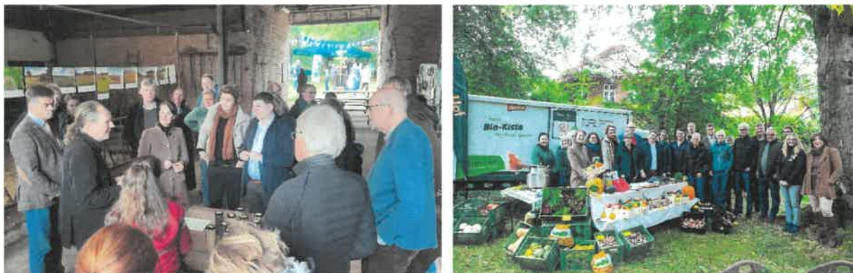
Abbildung 37 + 38: Ö-KO-LAB: Hoffest auf dem Bioland-Hof Ostermann zum Aktionstag des KÖN, 2024

Hofgeschichten. Für das leibliche Wohl war vielfältig gesorgt und an einigen Ständen konnten zudem Produkte getestet werden.