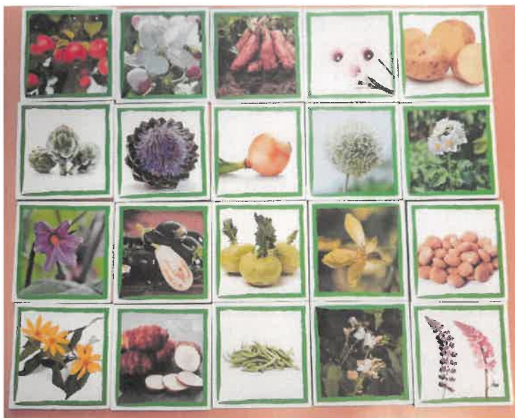
Abbildung 15: ÖMR UE - Blütenmemory als Kommunikations-Tool

Mit der Erkenntnis des spielerischen Zugangs entwickelte das PM in diesem Förderzeitraum einen „Ökomotion-Automaten“, um ins Gespräch zu kommen. Der Schwerpunkt liegt auf dem Thema Lebensmittelwertschätzung. Diese entsteht, wenn eine Beziehung zu dem Produkt herrscht, welche unmittelbar mit Gefühlen verbunden ist. So kann man bei dem „Ökomotion-Automaten“ Gefühle wie Erdung, Energiekick und Umarmung bestellen und bekommt ein passendes Produkt (z.B. Erdung – Kartoffeln von Kartoffelvielfalt Ellenberg, Energiekick – Ingwershot von Voelkel). Bei der Premiere auf dem Hoffest in Eimke am 3. Oktober 2024 (siehe 3.4.1.) wurde unser charmanter Automat „Coco“ so gut angenommen, dass wir damit weitere Öffentlichkeitsarbeit auf Märkten und im Lebensmittelhandel betreiben haben.