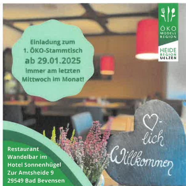
Abbildung 13: Screenshot Newsletter ÖMR UE

Der regelmäßig erscheinende Newsletter der ÖMR-Heideregion Uelzen stellt Informationen rund um das Projekt in Kurzform zusammen und lädt die Empfänger:innen durch Verlinkungen dazu ein, sich auf der Website www.oeko-fuer-uelzen.de mit weiterführenden Informationen zu den jeweiligen Themen zu versorgen. Von Juni 2024 bis April 2025 wurden sieben Newsletter an den Verteiler verschickt, der rund 120 Personen umfasst.