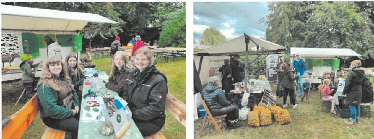
Abbildung 33 + 34: Ö-KO-LAB: Hoffest auf dem Bioland-Hof Ostermann in Eimke, 2024

Am 11. September 2024 eröffnete das PM der ÖMR UE das Projekt mit einem Vortrag über die Arbeit der ÖMR und deren Öko-Akteure. Anschließend erarbeiteten die Schüler:innen der land- und forstwirtschaftlichen Klassen ihre Projektthemen – Kartoffeln, Biodiversität, natürliche Ressourcen und Gewässerkunde. Die Ergebnisse wurden schließlich beim Hoffest in Eimke am 3. Oktober 2024 (siehe auch 3.4.1.) einem breiten Publikum präsentiert.