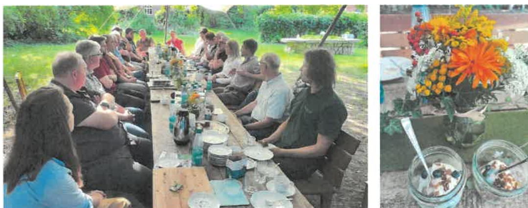
Abbildungen 28: Teilnehmerkreis, Abbildung 29: Buchweizen-Verkostung

Großer Zuspruch kam von den Teilnehmenden für eine sehr gelungene Veranstaltung entlang der Wertschöpfungskette.