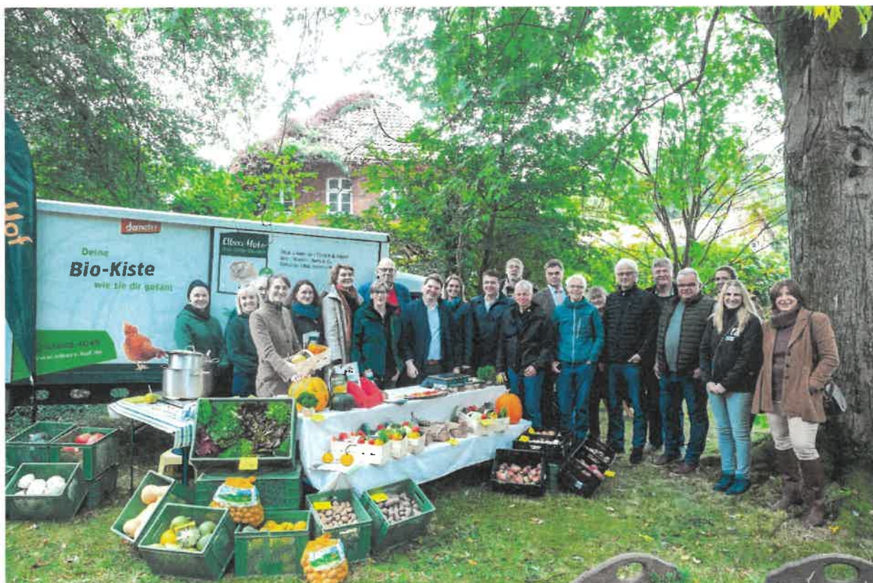
Abbildung 1: Ö-KO-LAB: Hoffest auf dem Bioland-Hof Ostermann zum Aktionstag des KÖN, 03.10.2024