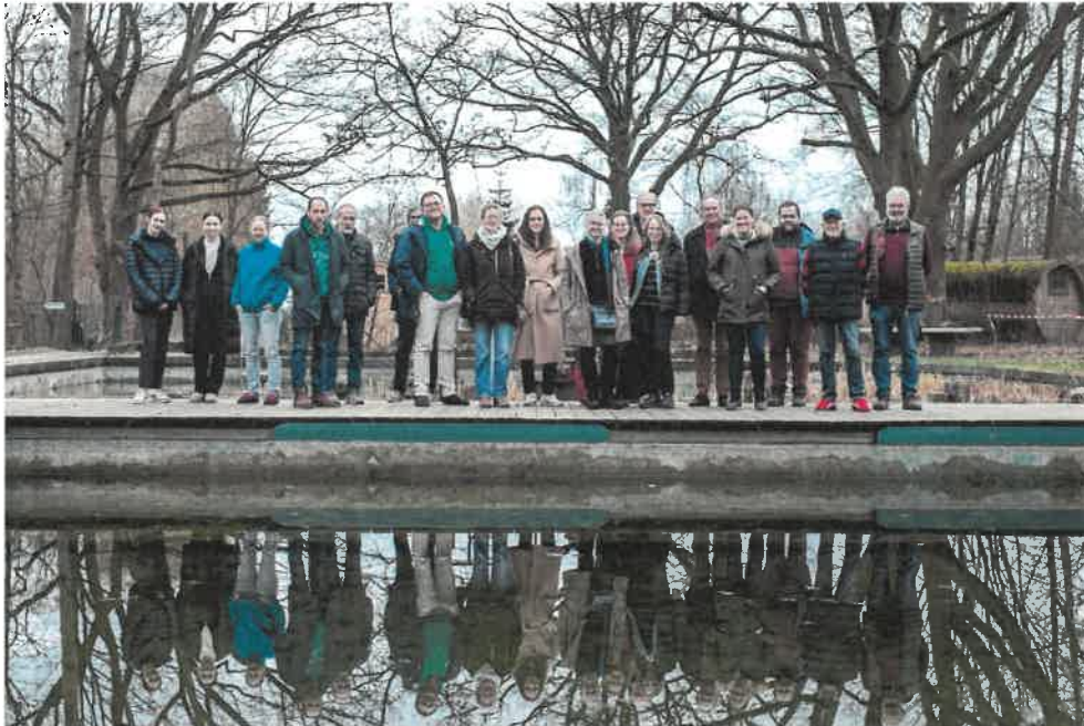
Abbildung 39: Ö-KO-LAB: Öko-Stammtisch, Uhlenköper Camp Westerweyhe, 2025

Die Teilnehmenden kommen von Öko-Betrieben (Ackerbau, Tierzucht, Gastronomie), der Landwirtschaftskammer und der hiesigen Wirtschaftsförderung. Themen sind u.a. Herausforderungen in der Direktvermarktung, Optimierung von Lieferketten, Suche von Abnehmern, KI im Betriebsalltag, Förderung gemeinschaftlich genutzter Maschinen, Generationswechsel, Personalnotstand, Tourismus, Schaffung von Partnerregionen zur Stärkung lokaler Produkte.