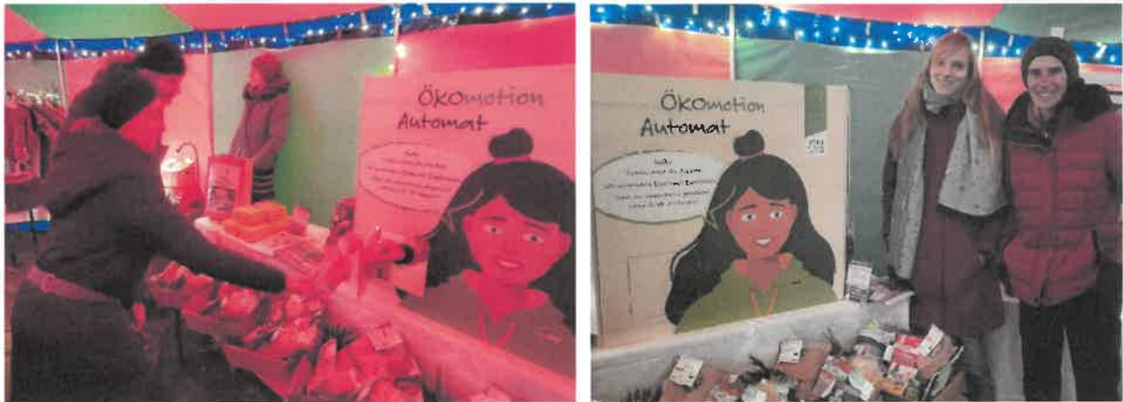
Abbildung 9+10: Bio-regionale Geschenkkörbe, Winterzauber, 21.12.2024

Die Körbe wurden zu einem attraktiven Preis angeboten, der unter dem regulären Handelspreis lag. Der Erlös kam der Biobrotbox-Initiative des ÖkoRegio e.V. zugute. Seit 15 Jahren verteilt diese Initiative Biobrotboxen an Erstklässler:innen in den Landkreisen Uelzen, Lüchow-Dannenberg und Lüneburg.