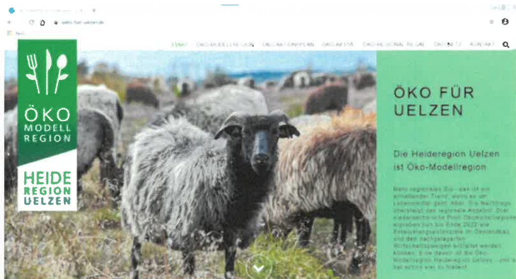
Abbildung 14: Screenshot der Website www.oeko-fuer-uelzen.de