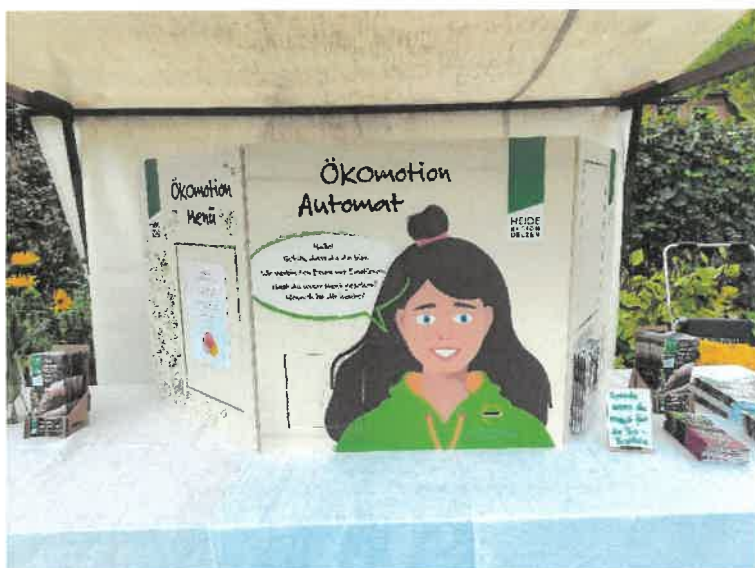
Abbildung 16: ÖMR UE – Ökomotion-Automat als Kommunikations-Tool

Mit der Erkenntnis des spielerischen Zugangs entwickelte das PM in diesem Förderzeitraum einen „Ökomotion-Automaten“, um ins Gespräch zu kommen. Der Schwerpunkt liegt auf dem Thema Lebensmittelwertschätzung. Diese entsteht, wenn eine Beziehung zu dem Produkt herrscht, welche unmittelbar mit Gefühlen verbunden ist. So kann man bei dem „Ökomotion-Automaten“ Gefühle wie Erdung, Energiekick und Umarmung bestellen und bekommt ein passendes Produkt (z.B. Erdung – Kartoffeln von Kartoffelvielfalt Ellenberg, Energiekick – Ingwershot von Voelkel). Bei der Premiere auf dem Hoffest in Eimke am 3. Oktober 2024 (siehe 3.4.1.) wurde unser charmanter Automat „Coco“ so gut angenommen, dass wir damit weitere Öffentlichkeitsarbeit auf Märkten und im Lebensmittelhandel betreiben haben.