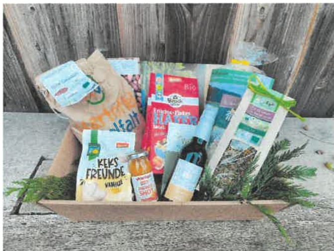
Abbildung 17: ÖMR UE – Regionale Geschenkkörbe zur Vermarktung bio-regionaler Produkte

Als zusätzliche Weiterentwicklung des ÖRRe zur Vermarktung bio-regionaler Produkte hat das PM regionale Geschenkkörbe entwickelt, die auf dem Nachhaltigen Weihnachtsmarkt am 21. Dezember 2024 an der Woltersburger Mühle verkauft wurden (siehe auch 3.4.4.).