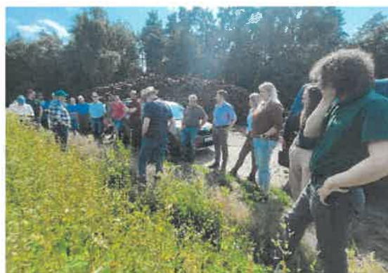
Abbildung 4 + 5: IM ÖKO-FELD: Feldtag Buchweizen in Eimke am 25.07.24

Zudem nahm das Projektmanagement der ÖMR UE am 17. Niedersächsische Fachforum Ökolandbau der LWK Niedersachsen am 7. November 2024 in Hannover-Ahlem teil. Dort konnte das PM die Möglichkeit der Vernetzung mit Kolleg:innen der LWK sowie den Projektmanager:innen der anderen ÖMR Nds. nutzen, die ebenfalls vor Ort waren.