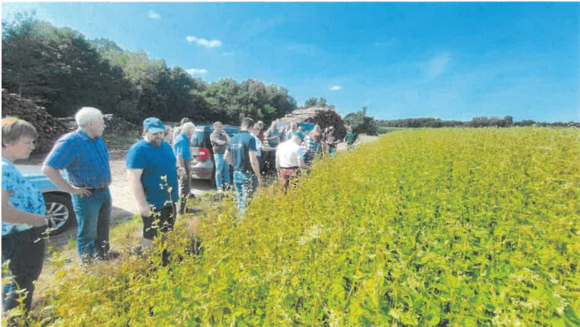
Abbildung 24: „IM ÖKO-FELD: Buchweizen“ auf dem Bioland-Hof Ostermann, Eimke, 2024