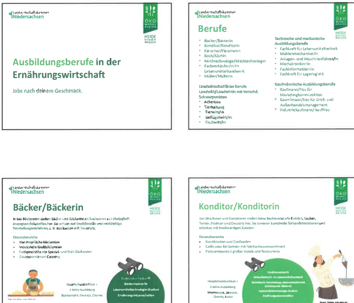
Abbildung 40: Screenshot aus Power-Point Präsentation

Das PM hat eine Powerpoint-Präsentation erstellt, um die Vielzahl der Ausbildungsberufe im Lebensmittelsektor in der Heideregion sichtbar zu machen, sowie die Betriebe, bei denen Ausbildungs- und Praktikumsplätze als auch ein freiwilliges, ökologisches Jahr möglich ist. Es wurden 27 mögliche Ausbildungsberufe dargestellt. Dazu wurde auch die Handwerkskammer informiert und gefragt. Die Aufstellung wurde an alle weiterbildenden Schulen im Landkreis verschickt für die Nutzung zur Berufsorientierung und mit dem Angebot in die Schulen zu kommen.