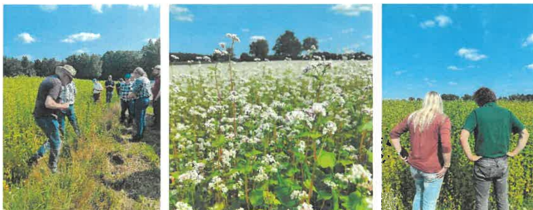
Abbildung 25 - 27: Feldbegehung, Bioland-Hof Ostermann in Eimke, 2024

In den letzten Jahrzehnten hat er eine neue Nische gefunden, denn das Pseudogetreide, das zu den Knöterichgewächsen gehört, ist von Natur aus glutenfrei. In unserer Region wird er von der Bauck Mühle als Spezialist für glutenfreie Mehle, Müslis, Porridges und mehr veredelt und vermarktet, allerdings kann er hier nicht geschält werden. Das gilt auch für die Bohlsener Mühle, die das Getreide ebenfalls als Mehl und Korn im Sortiment führt und in verschiedenen Produkten, wie auch in der Frischebäckerei, einsetzt. Vor dem geplanten Anbau empfiehlt es sich mit den Mitarbeitenden im Getreideankauf Kontakt aufzunehmen.