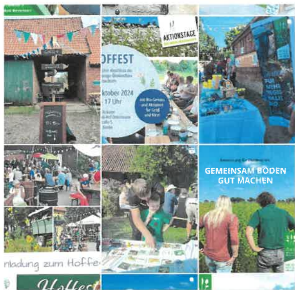
Abbildung 12: Ausschnitt Instagram-Feed

Der Bereich „Social Media“ der ÖMR Heideregion Uelzen wurde durch das PM weiter ausgebaut und gepflegt. Facebook und Instagram wurden prozessbegleitend genutzt. Neben der Kommunikation von bevorstehenden oder laufenden Veranstaltungen und Terminen postete das PM auch vermehrt Reels, um die Nahbarkeit zu verstärken. In der Zeit von Juni 2024 bis April 2025 wurden vom PM insgesamt 120 Beiträge gepostet. Derzeit verzeichnet der Instagram-Kanal oeko_fuer_uelzen 653 Follower. Auf Facebook folgen der ÖMR Heideregion Uelzen 295 Follower.